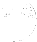
Il Sindaco Luca Malavasi

contro la presente Ordinanza ai sensi dell'art. 3 comma 4 legge n. 241/1990 e s.m.i. è ammessa la presentazione di ricorso a norma di legge.